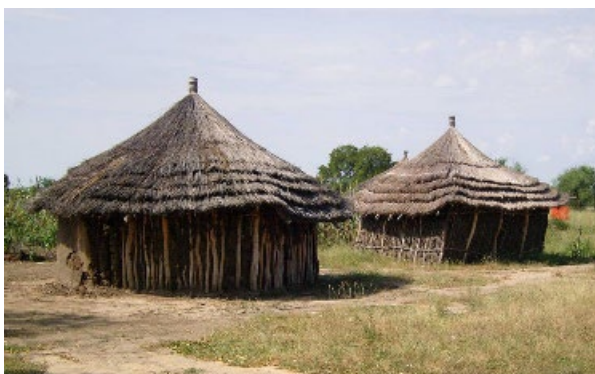
Foto: Tukul i Pibor

I byområder, som hovedstaden Juba, finner man mer moderne boliger, selv om mange fortsatt bor i enkle strukturer laget av bølgeblikk, tre og andre lett tilgjengelige materialer. Mange av byboerne lever under dårlige levekår i slumområder og uformelle bosetninger hvor de mangler tilgang til grunnleggende tjenester og infrastruktur, lever under overbefolkning og ikke har tilgang til faste levebrødsmuligheter (UN Habitat-data).